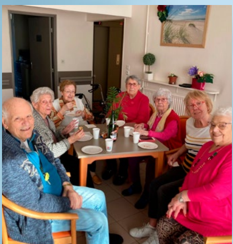
ON A FÊTÉ LA CHANDELEUR À LA RÉSIDENCE AUTONOMIE LOUIS-ARAGON