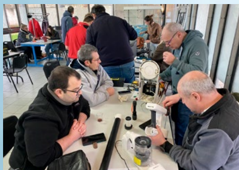
LES BÉNÉVOLES DU REPAIR-CAFÉ SONT BIEN OCCUPÉS LORS DE CHAQUE SESSION ! ON RÉPARE PLUTÔT QUE DE JETER !