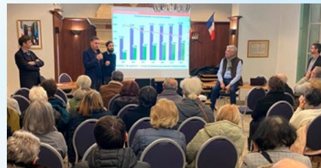
LA CONCERTATION SUR LE PROJET D'UNE NOUVELLE GENDARMERIE ET DE LOGEMENTS SE POURSUIT