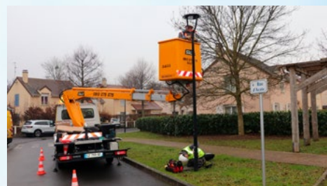
LE REMPLACEMENT DE L'ÉCLAIRAGE PUBLIC ET DES ARMOIRES ÉLECTRIQUES A DÉBUTÉ