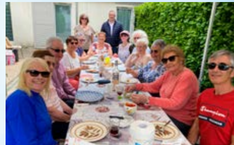
PAS MOINS DE 16 FÊTES DES VOISINS ONT DE NOUVEAU ÉTÉ ORGANISÉES CETTE ANNÉE ! BRAVO À TOUS LES INITIATEURS DE CES MOMENTS DE CONVIVIALITÉ !