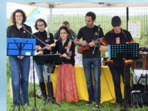
LA FÊTE DE LA NATURE PROPOSÉE PAR LA FERME PÉDAGOGIQUE ET SES PARTENAIRES A RENCONTRÉ UN JOLI SUCCÈS, COMME CHAQUE ANNÉE