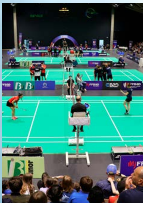
L'ORGANISATION DE LA FINALE DU CHAMPIONNAT DE FRANCE DE BADMINTON PAR LES MEMBRES DU BADMINTON CLUB ET SES BÉNÉVOLES A ÉTÉ UNANIMEMENT SALUÉE. LES ENFANTS PRÉSENTS POUR ENCOURAGER LE CLUB ONT MIS UNE FOLLE AMBIANCE