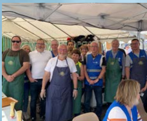
LA BROCANTE ORGANISÉE PAR LE ROTARY-CLUB MÉRU CHAMBLY A DE NOUVEAU ATTIRÉ LES FOULES