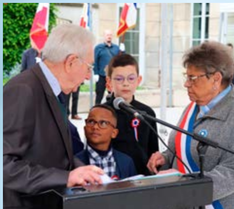
LES CAMBLYSIENS SONT VENUS NOMBREUX PARTICIPER AU DEVOIR DE MÉMOIRE LORS DE LA COMMÉMORATION DU 8 MAI 1945