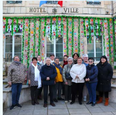
LE CONSEIL DES AÎNÉS A ENREGISTRÉ 12 ÉVOLUTIONS MAJEURES POUR LES FEMMES SUR LA PAGE FACEBOOK CHAMBLY MA VILLE À L'OCCASION DE LA JOURNÉE INTERNATIONALE DES DROITS DES FEMMES