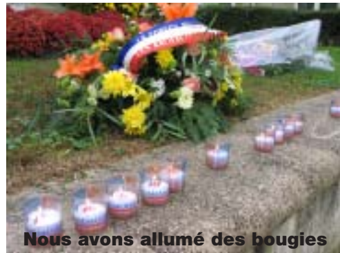
Nous avons allumé des bougies

Avant de commencer la cérémonie, nous avons vendu des bleuets aux habitants de Chambly. Nous avons fait ça pour donner l'argent aux associations des anciens combattants.