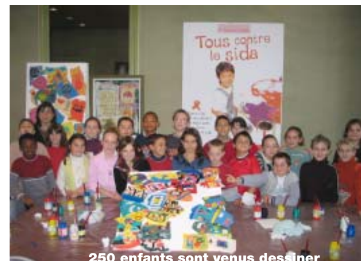
250 enfants sont venus dessiner

à côté des autres, derrière un grand rideau, on ne voyait pas la fresque. À la fin, nous avons compté 5...4...3...2...1... et nous avons coupé la ficelle avec le maire. Quand le rideau est tombé, on a vu la fresque de 3m sur 3m et tout le monde a applaudi. Le maire était très ému ! Puis nous avons pris le verre de la solidarité.