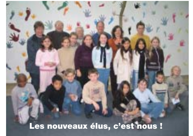
Les nouveaux élus, c'est nous !

Lundi 6 novembre, nous avons voté au gymnase Aristide Briand pour élire les représentants du CCE. Il y avait des papiers avec les prénoms des candidats écrits dessus, des isoïrs et des urnes pour mettre notre vote dedans. Nous, les candidats, nous avons présenté nos idées. Ensuite, tout le monde a voté chacun son tour en mettant dans l'urne le nom de son candidat préféré. En fait, nous avons voté comme des grands pour la première fois. On s'est même mis dans un isoïr ! Puis, au moment où nous avons mis notre vote dans l'urne, le Président disait « à voté ! ». Quand tout le monde a eu terminé, nous avons compté tous les votes. Ce moment là était assez stressant ! Comme pour les autres élections, ce sont ceux qui en avaient le plus qui ont été élus. Il y avait 2 ou 3 élus par classe de CM2.