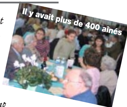
Il y avait plus de 400 aînés