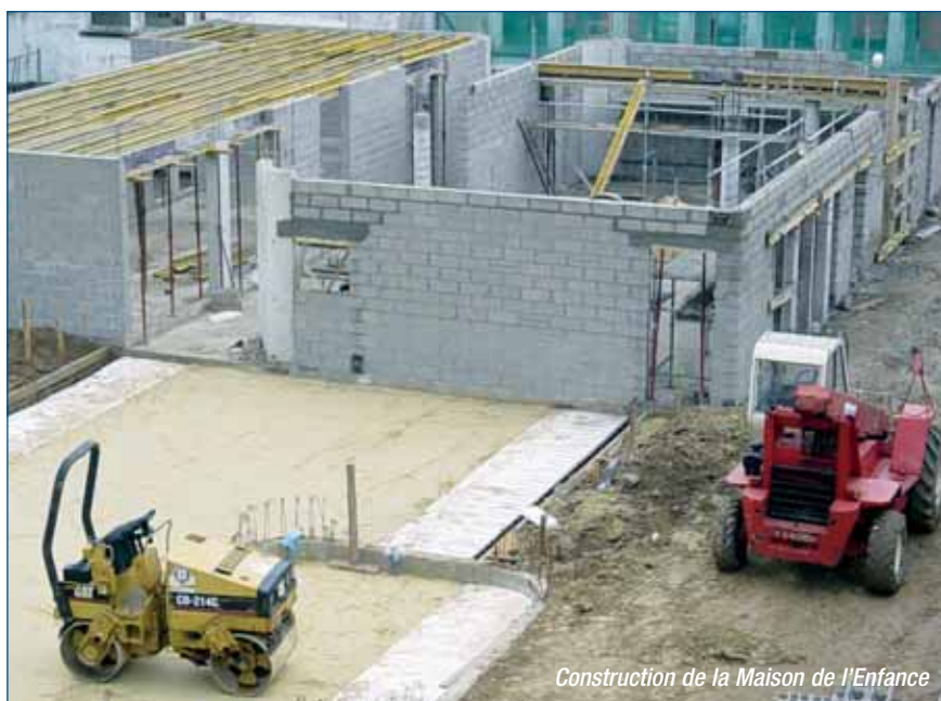
Construction de la Maison de l'Enfance