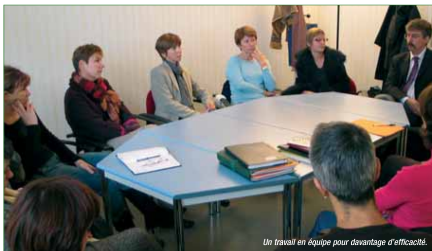
Un travail en équipe pour davantage d'efficacité.

PEU CONNUS DU GRAND PUBLIC, LES CENTRES MÉDICAUX PSYCHO-PÉDAGOGIQUES (CMPP), COMME CELUI DE CHAMBLY, JOUENT UN RÔLE IMPORTANT EN MATIÈRE DE SOINS RELATIFS À LA SANTÉ MENTALE DES ENFANTS ET ADOLESCENTS.