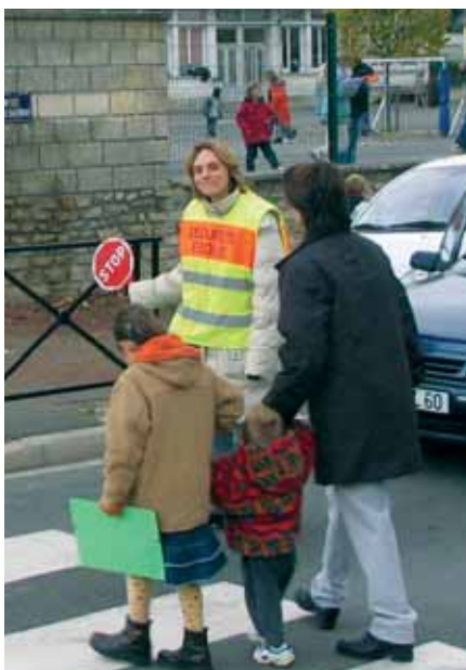
Sécurisation des sorties des écoles

Journal de Chambly : L'équipe de la police municipale s'est beaucoup étoffée ces dernières années, dans quel but ?