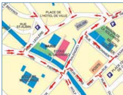
Le nouveau sens de circulation du centre-ville