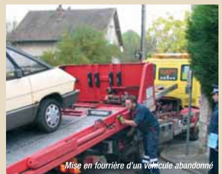
Mise en fourrière d'un véhicule abandonné

Les agents de la police municipale sont habilités à demander la mise en fourrière des véhicules en infraction caractérisée et des épaves. Dans le cas d'un stationnement gênant ou dangereux, cette action est réalisée après un contact préventif avec le propriétaire du véhicule concerné.