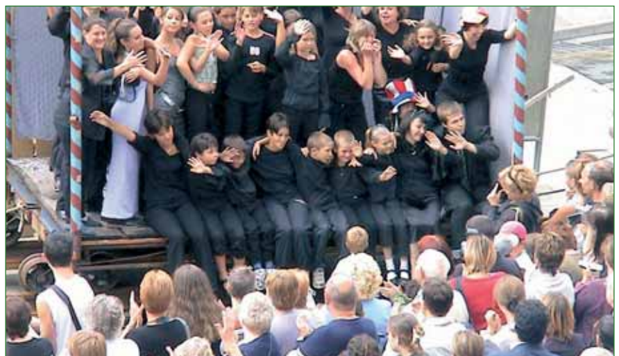
Chambly dans la rue

PARLONS D'AVENIR... Gros dossier en cours, le Centre culturel. Avec en premier lieu la création d'une salle de spectacles de 600 places dont l'ouverture est programmée en 2007. Une structure devenue indispensable au vu de l'activité culturelle bouillonnante de la ville. L'endroit idéal pour y accueillir représentations de théâtre, spectacles de danse, one-man shows, cirques de qualité... Vivement !